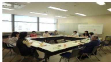
おしゃべり会の様子

あけぼの兵庫は、さまざまな行事を通して上記の活動に取り組んでいます。現在、乳腺専門医の顧問医 6名が充実した協力体制で乳がん患者の支えになってくださっています。