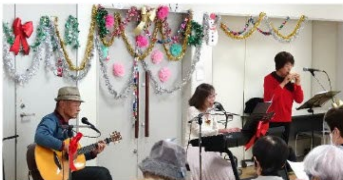
クリスマスコンサートの様子