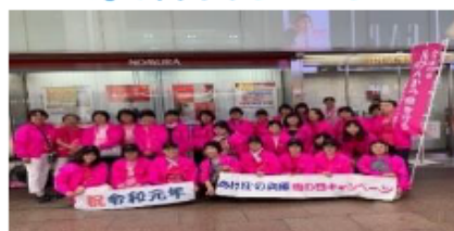
母の日キャンペーン